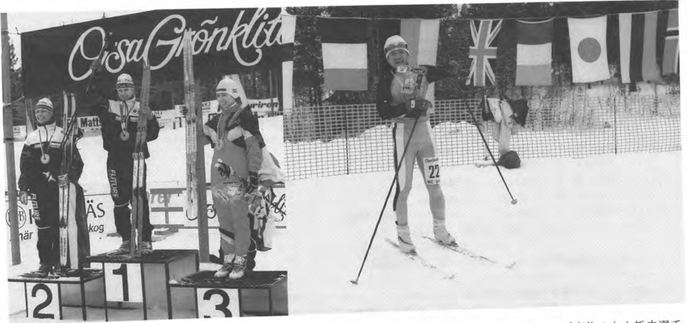
ショートディスタンス女子表彰選手