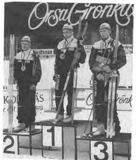
ショートディスタンス男子表彰選手